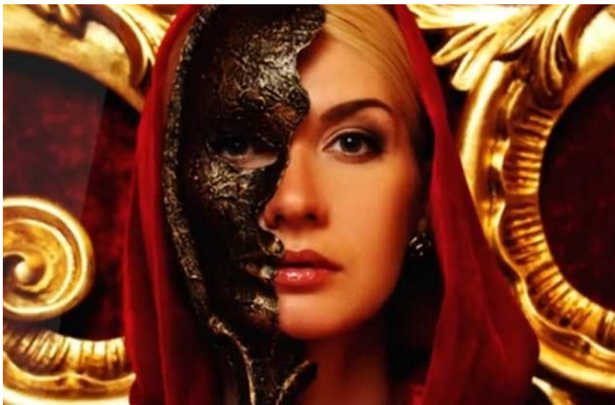
Die twee gesigte van 'n persoon met Isebelgees

bedreig. Wanneer jy by so iemand is en van jou eie prestasie of oorwinning vertel, kan jy verseker wees dat hy of sy vinnig sal vertel van iets beter of groter wat hy/sy vermag het.