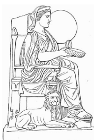
Rhea Mother of Gods

-The Origin of Christianity by A.B. Traina