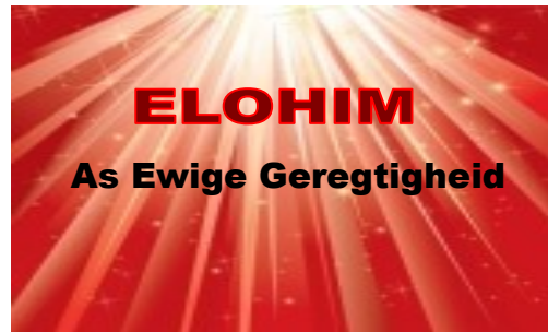
Diagram 1 Die Skepping van die Drie en die Sewe Die Skepping van die Drie en die Sewe

Die Ewige ontoeganklike Godheid/ Elohim wat gebaai is in ontsaglike verblindende Lig waarin GEEN