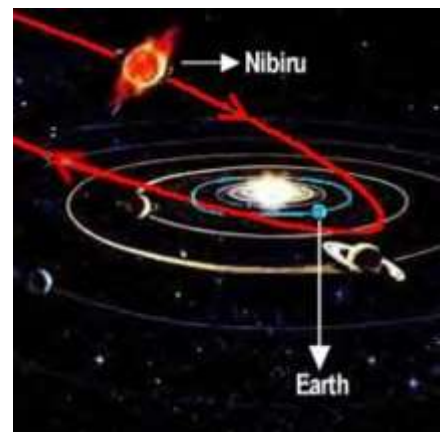
Nibiru se baan