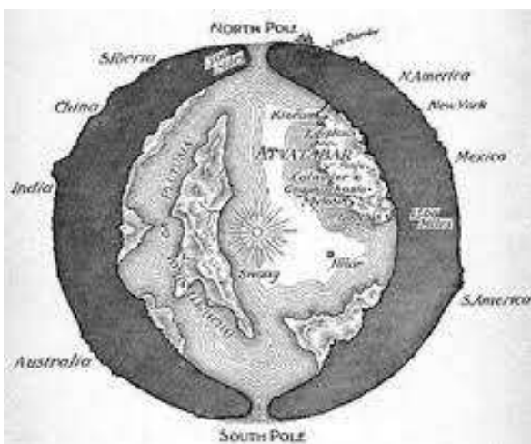
Illustrasie van die binnekant van die aarde